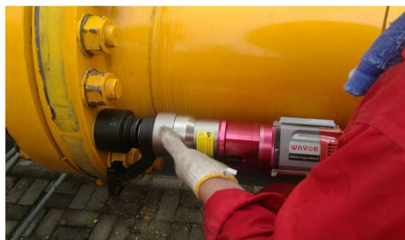
ETW-26S用于西气东输管道螺栓拆装