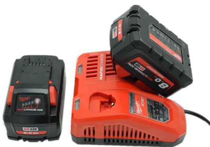
标配8安时电池2块，快充1个