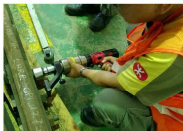
RMW-26用于地铁轨道螺栓拆装