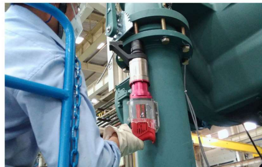
ESW-12用于大型制冷设备螺栓装配